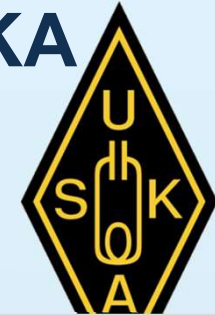
Sektionen: Total Mitglieder versus USKA Mitglieder