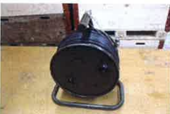
Kabelrolle Typ I mit 60m Kabel RG213/U