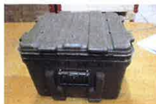
Kiste enthält Antennenmaterial SE-430