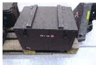
Kiste ZUB S-430, Enthält Kabeltrommel, Armeetelefon und Kabel