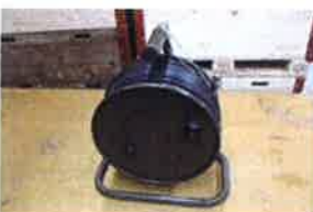
Kabelrolle Typ I mit 60m Kabel HF 50 OHM mit Gestell