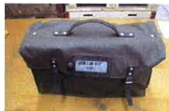
Tasche ZUB I BE-430, Enthält diverse Telefone