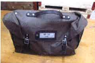
Antennenzubehör in Tasche NA-430