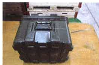
Kiste enthält Antennenmaterial SE-430