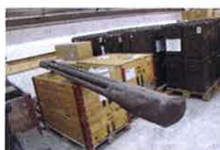
Mastbund mit 4 Mastrohren und zwei Hauben aus Kunststoff