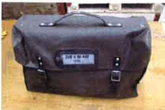
Tasche ZUB II BE-430, Enthält Antennenmaterial